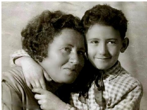
Я и мама в 1939 г

все места, то в военный госпиталь. Больше половины из нашей группы, в основном люди старшего поколения, из больницы не вернулись, и были похоронены в Намангане. Мы с мамой были в военном госпитале и выздоровели.