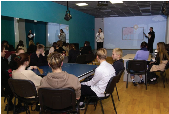
Рис. 1. Проведение профилактического мероприятия несовершеннолетними

В рамках программы осуществляется создание, подготовка и проведение мероприятий, направленных на профилактику девиантного поведения среди молодежи.