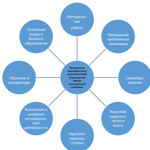
Рис. 1. Система деятельности по повышению квалификации руководителей учреждений сферы молодежной политики

Система деятельности по повышению квалификации руководителей учреждений сферы молодежной политики представлена на рисунке 1.