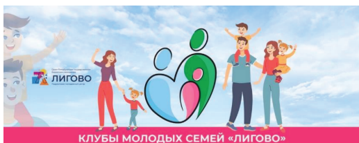
Рис. 1. Обложка группы в социальной сети ВКонтакте «Клубов молодых семей СПб ГБУ «ПМЦ «Лигово»

В рамках работы клубов молодых семей проводятся индивидуальные и групповые беседы, лектории, группы взаимоподдержки, досуговые мероприятия, которые предполагают активное участие молодых семей, молодых родителей и детей.