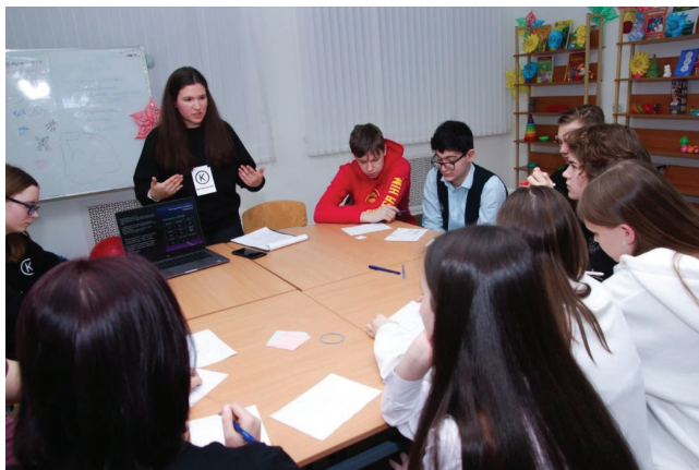
Рисунок 2. Привлечение несовершеннолетних к организации и проведению мероприятий профилактической направленности

Заведующие, специалисты по работе с молодежью и специалисты по социальной работе с молодежью участвуют в районных, городских и всероссийских мероприятиях по профилактике асоциального поведения, терроризма и социальных зависимостей, проходят курсы повышения квалификации, участвуют и организуют мероприятия с целью повышения эффективности профилактической деятельности с субъектами системы профилактики.