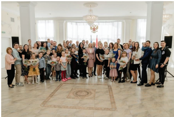
Рис. 2 Проведение семейного праздничного мероприятия «Мама, папа, я – Красносельская семья», посвященного Международному дню семьи