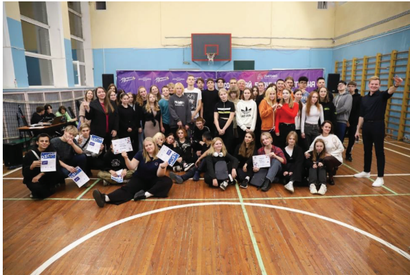
Рис. 1. Участники познавательного квиза «Марафон профессий»