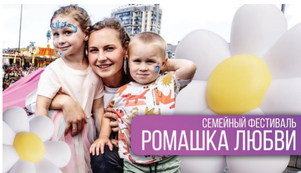
Рис. 3 Проведение Фестиваля «Ромашка любви», посвященного Дню семьи любви и верности

Об эффективности деятельности клубов молодых семей, профилактических и досуговых мероприятиях для молодых семей свидетельствуют результаты опросов, наполняемость групп, сохранение контингента и привлечение новых участников.